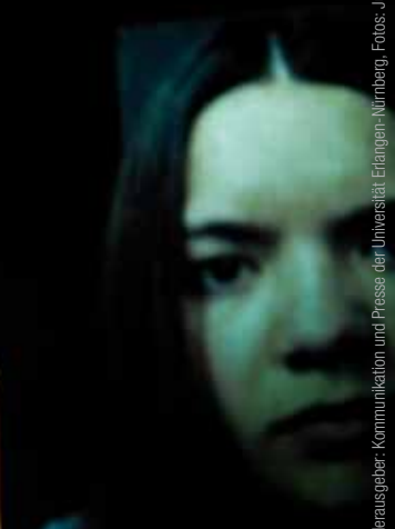
Herausgeber: Kommunikation und Presse der Universität Erlangen-Nürnberg, Fotos: Julian Gabrysich, Günter Frenzel, Kätlin Beechhold, Gestaltung: Andrea Förster